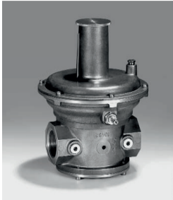
Umlaufregler Typ: KROMSCHRÖDER VAR