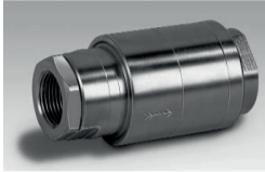
Gasrücktrittsicherung Typ: KROMSCHRÖDER GRS

Brenner in industriellen Thermoprozess- und Heizungsanlagen sowie Blockheizkraftwerken benötigen einen minimalen Versorgungsdruck. Steht am Brenner nicht genügend Gasdruck zur Verfügung, beispielsweise durch hohe Druckverluste im Leitungssystem, kann der Einsatz einer Gasdruckerhöhungseinrichtung notwendig werden. Besonders bei Biogasanlagen, in denen der Gasdruck verfahrensbedingt sehr niedrig ist, bietet sich der Einsatz an, wenn direkt ein Verbraucher – etwa ein BHKW – betrieben wird.